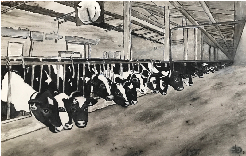
Dessin Rose de la Haye

Les êtres humains pensent qu'ils sont les seuls à penser et se disent qu'ils sont les seuls à dire.