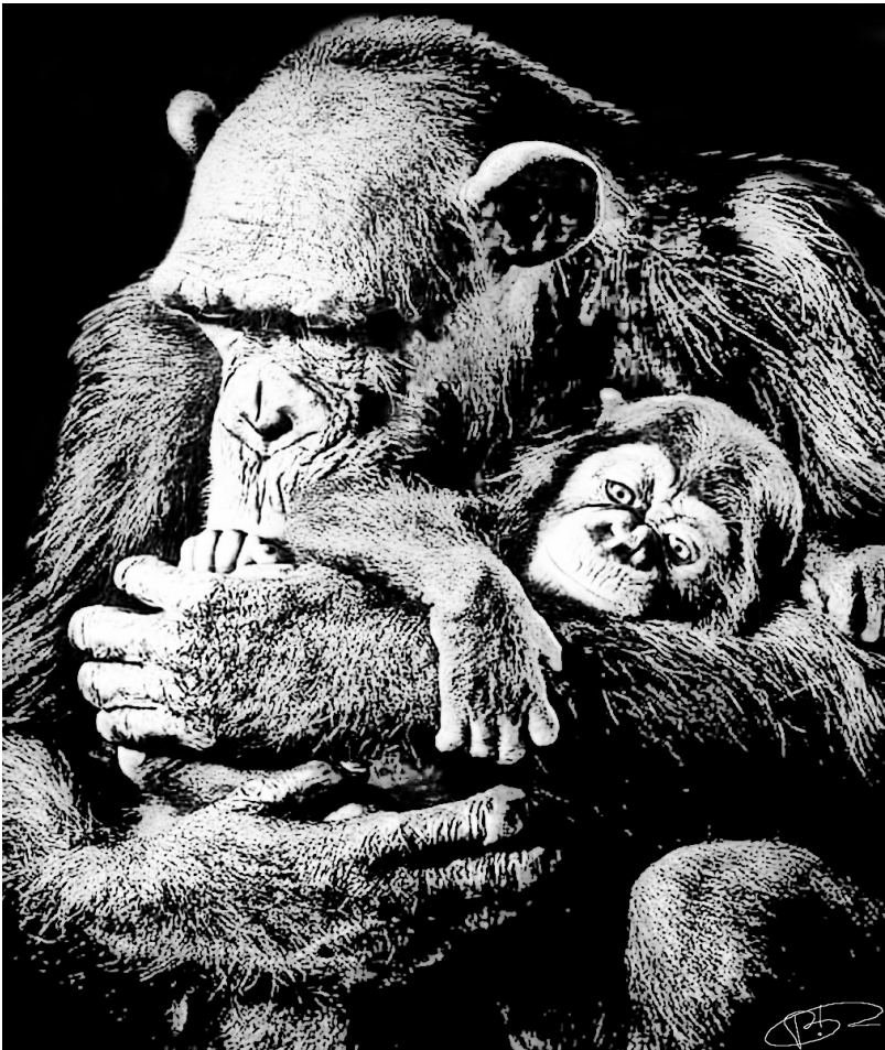
D'après une photo de Tim Flach

J'avais une mère, que j'adorais de toute la force de mon cœur et qui m'aimait aussi, deux sœurs et un frère, de nombreux amis et amies. Comme dans tous les groupes sociaux, on se querellait, on se réconciliait, on jouait, on s'entraidait. Je m'amusais avec d'autres enfants de mon clan. Parfois, le grand mâle dominant, le patriarche, m'accordait des moments d'attention, quelques caresses ou affectueuses taquineries. Nous vivions, en résumé ! Il y a vingt ans de cela, un matin, on tua ma mère pour me capturer. Dans mes pensées, j'entends toujours les coups de feu. Là, en ce moment même, au moment où je t'en parle, ils résonnent dans ma mémoire marquée au fer rouge ; d'ailleurs, quand j'avais encore un cœur, il accélérât ses battements chaque fois que j'évoquais ce drame. J'étais