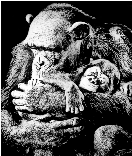
D'après une photo de Tim Flach

J'avais une mère, que j'adorais de toute la force de mon cœur et qui m'aimait aussi, deux sœurs et un frère, de nombreux amis et amies. Comme dans tous les groupes sociaux, on se querellait, on