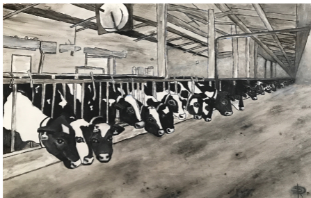
Dessin Rose de la Haye

Les êtres humains pensent qu'ils sont les seuls à penser et se disent qu'ils sont les seuls à dire.